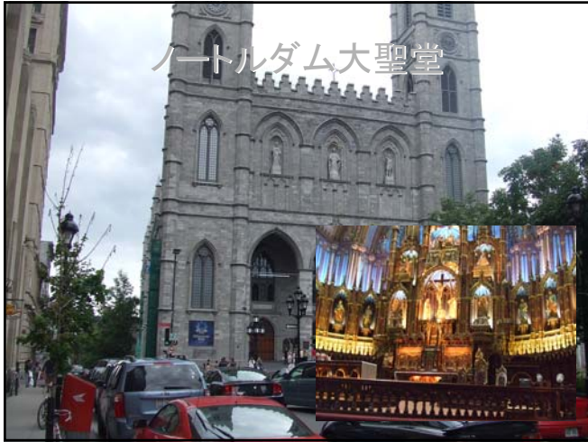
ノートルダム大聖堂