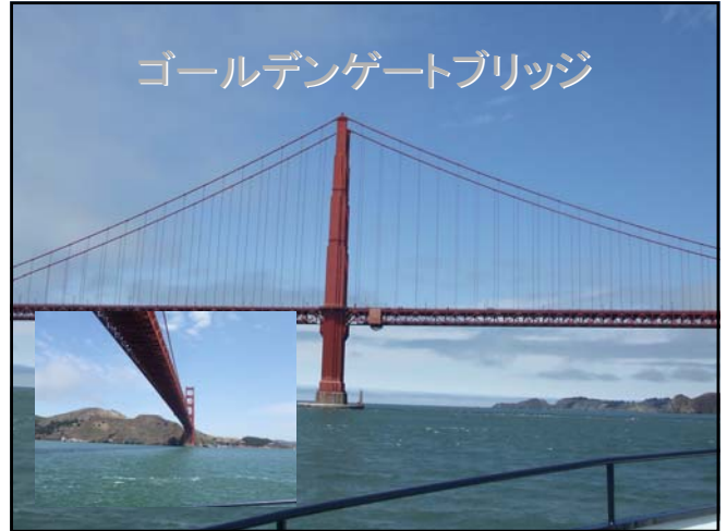
ゴールデンゲートブリッジ