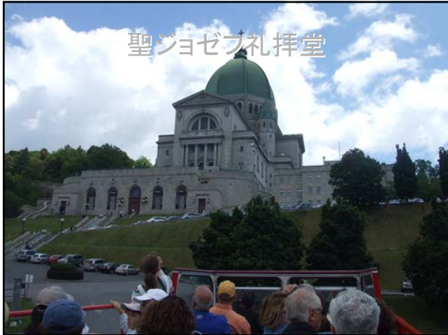
聖ジョゼフ礼拝堂