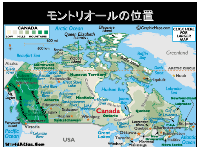
モントリオールの位置

37th COSPAR Scientific Assembly 第37回宇宙研究会議科学総会 13-20 July 2008, Palais des Congrès de Montreal, Montreal, Canada